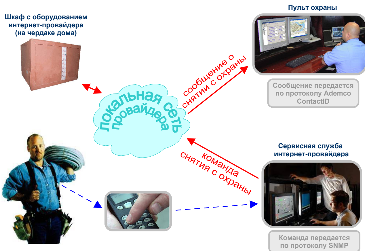
Рис.6.3. Типовое решение №2. Техническое обслуживание шкафа с коммуникационным оборудованием. Шкаф снимается с охраны по команде дежурного сервисной службы интернет-провайдера. На пульт охраны ЧОП передается сообщение о снятии объекта с охраны.

Таким образом, состояние ящиков с дорогостоящим коммуникационным сетевым оборудованием круглосуточно контролируется частным охранным предприятием и самим интернет-провайдером. А на установку и настройку охранных приборов охранным предприятием было затрачено минимум усилий и средств.