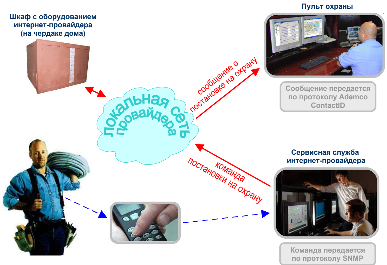
Рис.6.4. Типовое решение №2. Техническое обслуживание шкафа с коммуникационным оборудованием закончено. Шкаф ставится на охрану по команде дежурного сервисной службы интернет-провайдера. На пульт охраны ЧОП передается сообщение о снятии объекта с охраны.